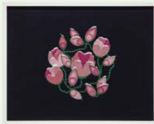
Katherine Boyer, The Cycle Shifts Clockwise , 2018. Petites perles sur étoffe en laine tissée. Collection d'œuvres d'art de la TD.