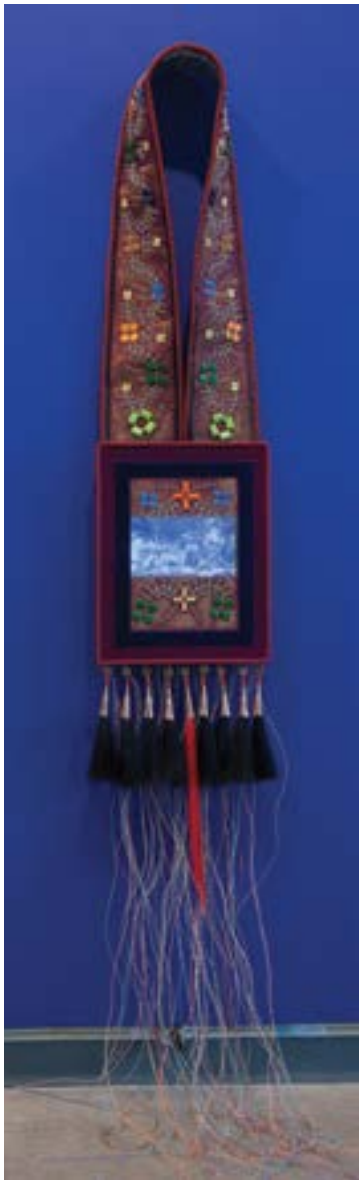
Barry Ace, Bandolier for Wiikwemkoong , 2017. Velours, cuivre, composantes électroniques, crins de cheval, fils, perles et écran vidéo. Collection d'œuvres d'art de la TD.

œuvres de la collection de la TD sont présentées au public dans une galerie permanente