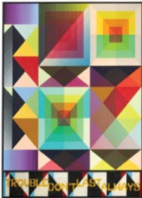
Jeffrey Gibson, Trouble Don't Last Always , 2019. Acrylique sur toile, perles de verre, tendons artificiels et cadres de bois sur mesure. Collection d'œuvres d'art de la TD.