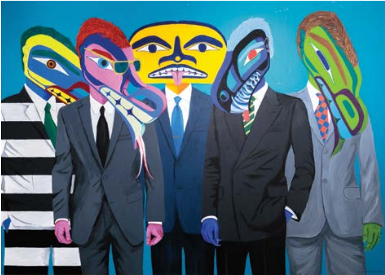
Lawrence Paul Yuxweluptun, Office Party , 2018, huile sur toile, collection d'art de la TD