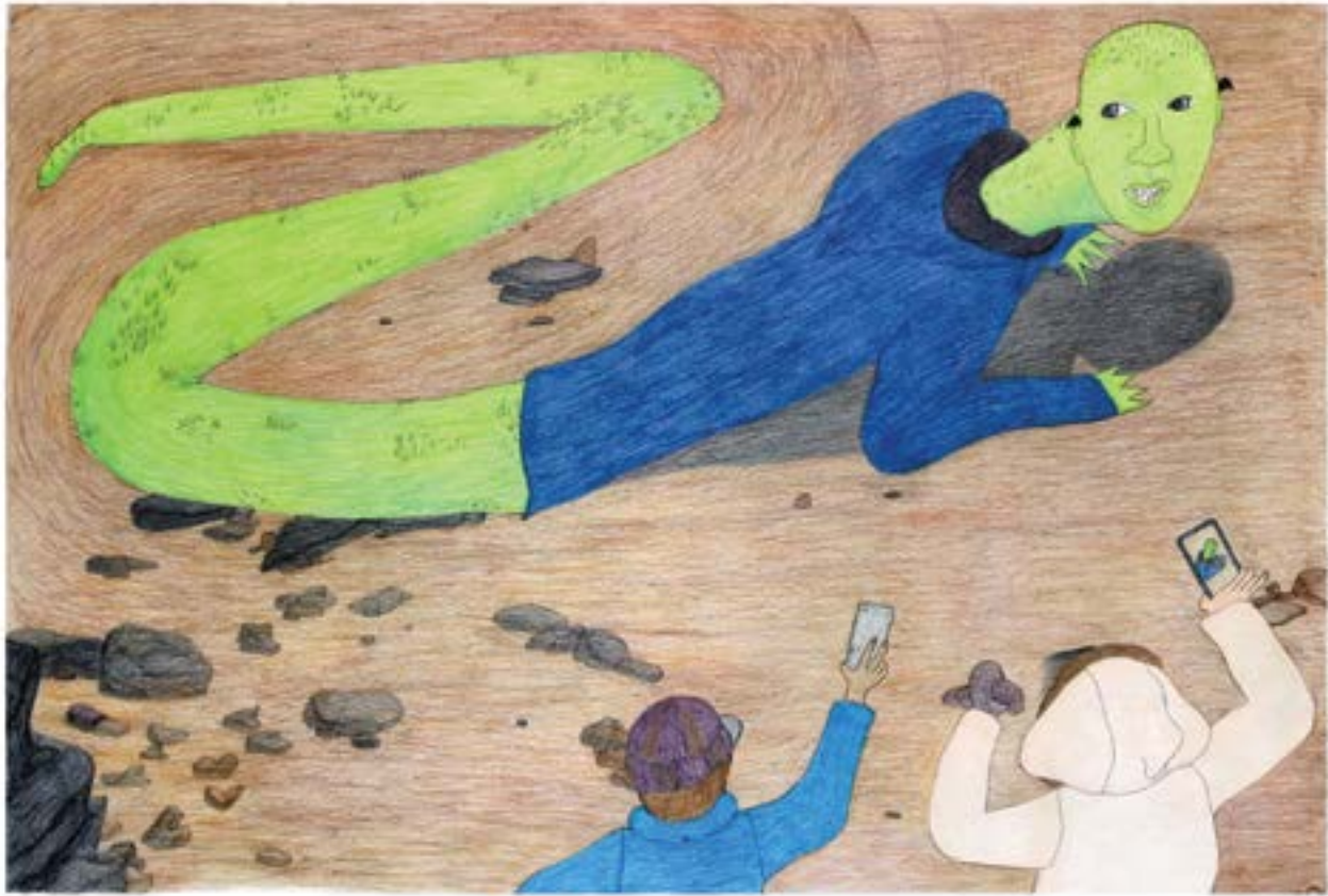
Shuvina Ashoona, Taking Pictures of the Creature , 2016. Encre et crayons de couleur. Collection d'œuvres d'art de la TD.