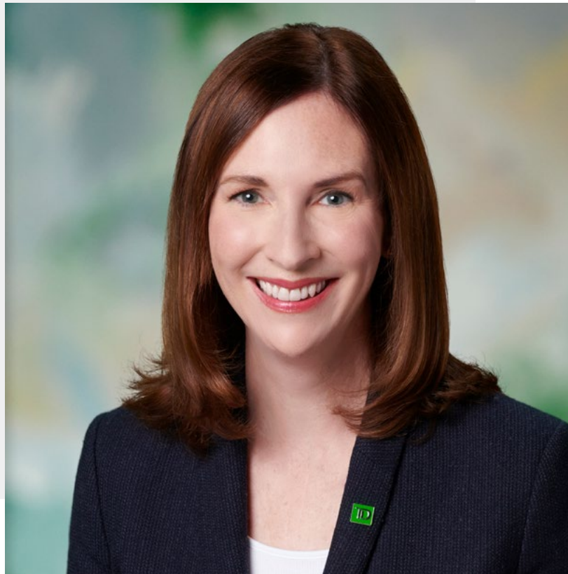
Première vice-présidente, Développement durable et Responsabilité sociale

L'année 2021 nous a beaucoup amenés à réfléchir. Elle a aussi amplifié la nécessité d'agir de façon à favoriser un changement positif et tangible dans la société. Nous devons affronter les défis collectifs liés à la crise sanitaire mondiale et ses répercussions de plus en plus importantes sur les collectivités, les inégalités raciales et systémiques persistantes, l'aggravation des changements climatiques et les crises humanitaires mondiales. Pour trouver des solutions à ces problèmes locaux, nationaux et même mondiaux, nous avons plus que jamais besoin d'actions concertées du gouvernement et du secteur public, des entreprises et de citoyens engagés. À la TD, nous nous engageons à faire partie de la solution.