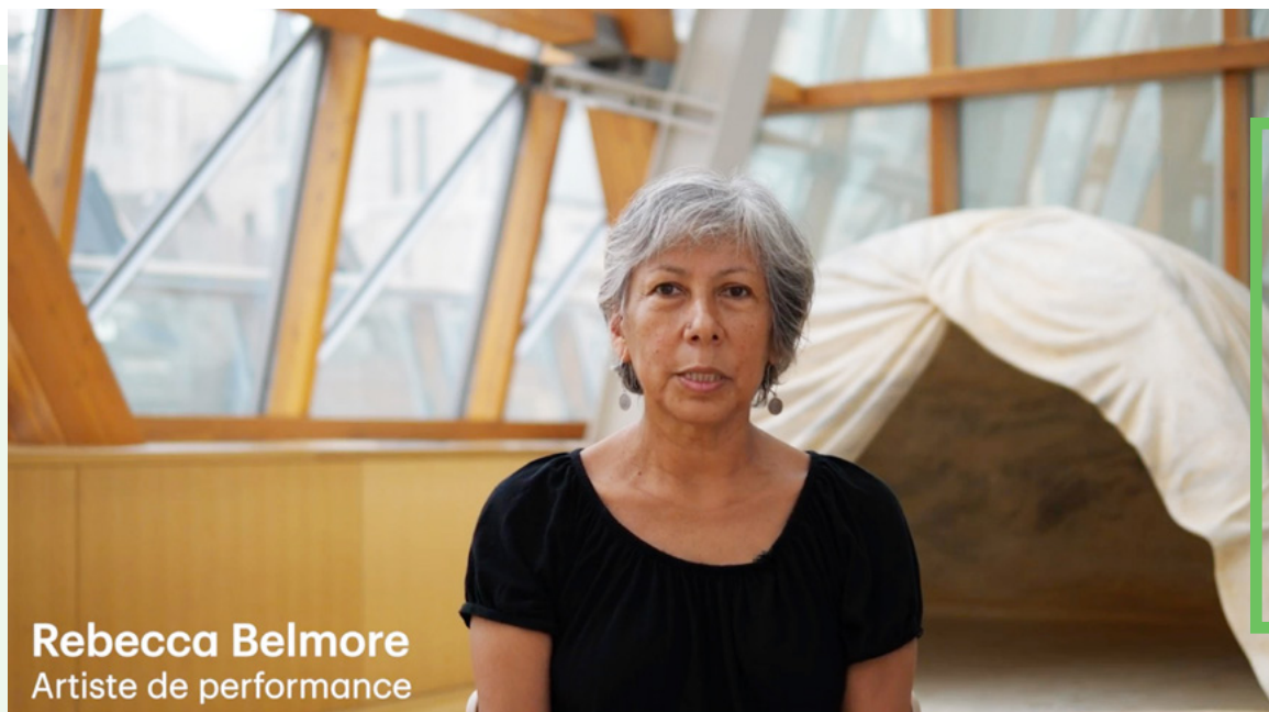
Rebecca Belmore Artiste de performance

À Greenville en Caroline du Sud, nous soutenons depuis 15 ans Artisphere , l'un des dix plus importants festivals d'art au pays. L'événement a pris de l'ampleur au fil des ans et attire maintenant environ 85 000 visiteurs qui viennent vivre des expériences : expositions d'art visuel, prestations d'artistes locaux et nationaux, spectacles de musiciens de rue, numéros d'amuseurs publics et bien plus. On évalue aussi les retombées économiques à 6,4 millions de dollars américains dans la collectivité de Greenville.